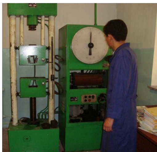
Определения класса арматуры