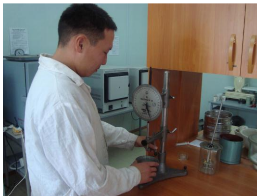
Проверка твердости битума