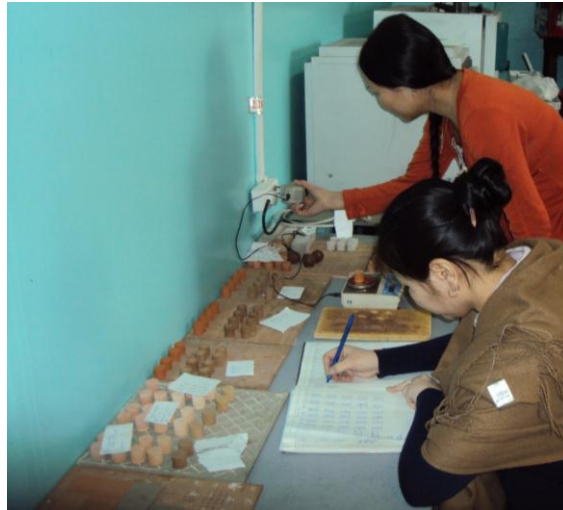
Исследование свойств глин месторождений Республики Тыва на базе научно-исследовательской лаборатории