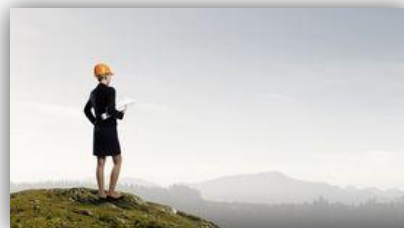
Системный горный инженер