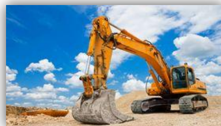
Специалист по горным работам